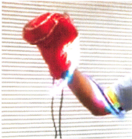
図3 凄パンチ (I.K氏*2 製作 2015年)