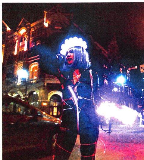
図 2 EL ワイヤ緊縛