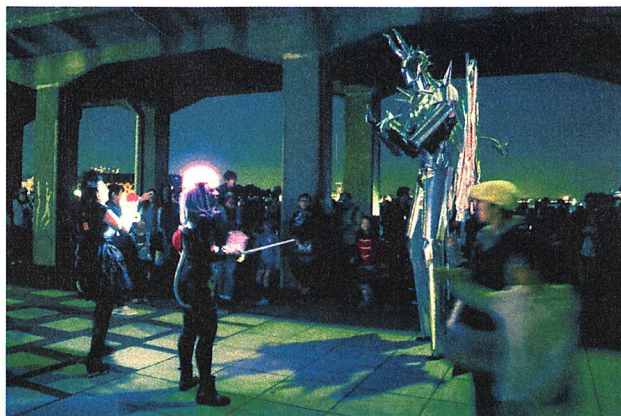
図5 巨大ロボットとの LED アレイパフォーマンス共演に群がる観客とその視線