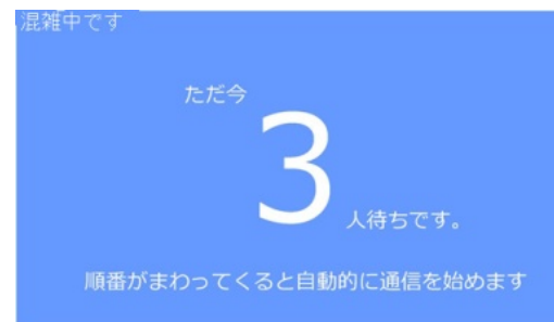
図 2 待機通知の Web ページ

また輻輳が起きていない場合にも電波の状態等により通信に失敗することがある。こういったバックボーン側の通信障害には通信制御サーバからリクエストを再送することで対応し、クライアントがリクエストを再送する手間や再送によるリクエストの増加を防ぐ。